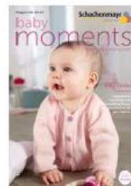
Magazine001 Art. 9855001-00001/4