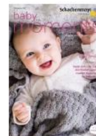
Magazine017 Art. 9855017-00001/4a