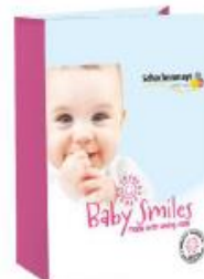
Borsa Baby Smiles Set 50 borse carta Art. 9854783-00001 22 x 27 x 10 cm 31,50 €/unità