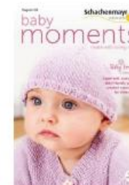
Magazine011 Art. 9855011-00001/4

3 magazine con schemi e modelli a tema con traduzione in italiano