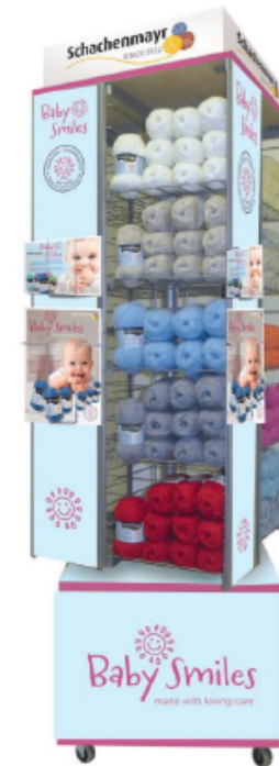
Display girevole Art.9854505-00001 165x60x60 296,56 €