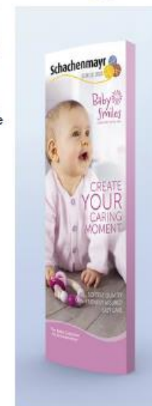
Baby Smiles Totem Art. 9854506-00001 20,00€