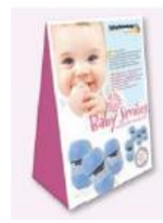
Display per vetrina Art. 9854784-00001 56x40x23 omaggio