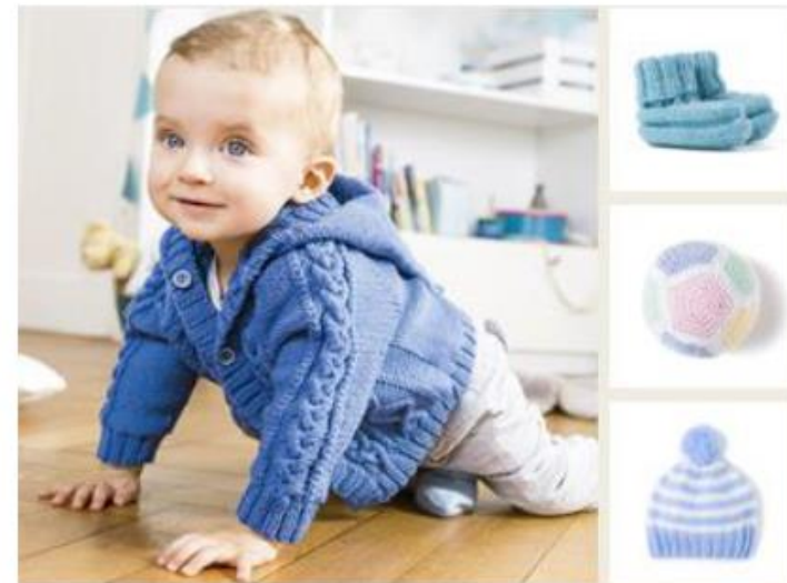
Baby Smiles Designs & Patterns